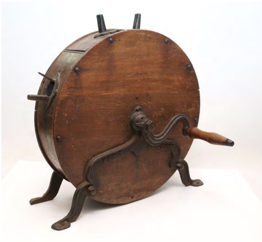
Een messenpoetsmachine (collectie Oudheidkamer)

Wist u dat onze oudheidkamer al 64 jaar bestaat en de heemkundekring pas 41 jaar!